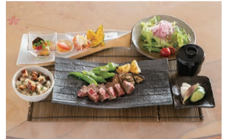
目の前でグリルされる鉄板焼きを堪能! お得なランチメニューをペアで(写真はイメージです)