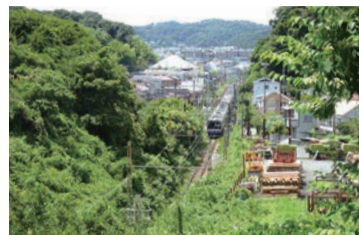
名越切通/鎌倉側入り口付近からの眺望。入り口は鎌倉駅東口から徒歩20分