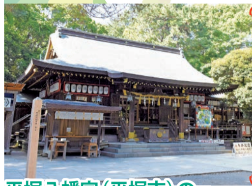
平塚八幡宮 平塚市浅間町1ノ6 JR平塚駅から徒歩8分