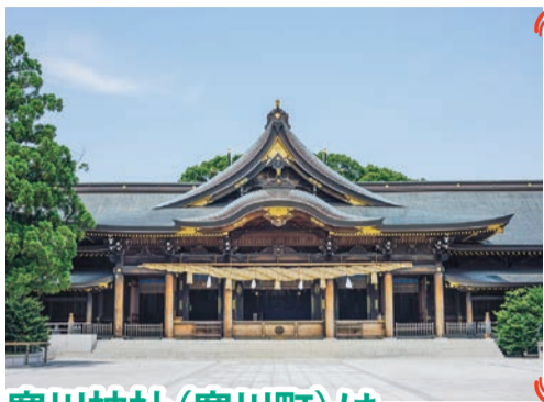
寒川神社 寒川町宮山3916 JR相模線宮山駅から徒歩8分

平塚八幡宮のうまいく守 うまいく守 平塚八幡宮 気配を敏感に察知し、福を招き災難を除けるといわれる馬。表裏合わせて神馬の九つの姿が描かれた「うまいく守」1000円