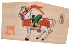
▲神馬絵馬(初穂料800円) ※常時頒布しています