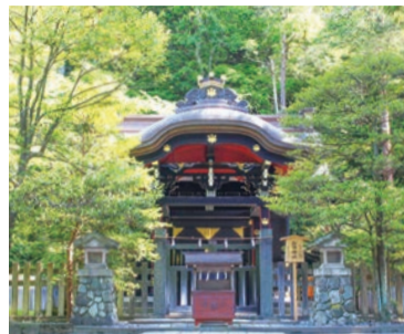
白旗神社 鎌倉市雪ノ下2-1-31 鎌倉駅下車徒歩13分