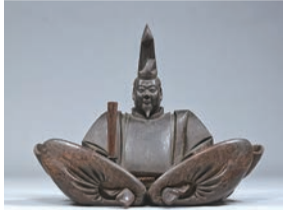
源頼朝坐像 東京国立博物館蔵

東京国立博物館に収蔵されている源頼朝坐像（国重文）は、鶴岡八幡宮境内の白旗神社に安置されていたものと伝わります。狩衣（かりぎぬ）姿で笏（しゃく）をもち、高い烏帽子（えぼし）姿、両脚を倒した威厳のある姿の像です。像高90.3cmで木像、彩色、玉眼入りです。