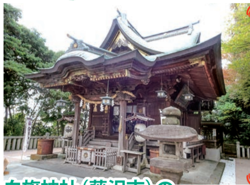
白旗神社 藤沢市藤沢2ノ4ノ7 小田急線藤沢本町駅から徒歩7分