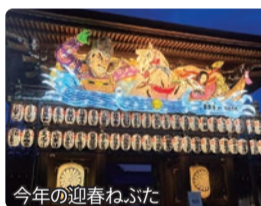
今年の迎春ねふた

寒川神社の正月風物詩“迎春ねふた”は、本年度で26回目を迎えます。今年は、丙午(ひのえうま)～那須与一「勝利的」～です。有名な源平合戦「屋島の戦い」で与一は馬上から波間に揺れる小さな扇の的を見事に射抜きました。