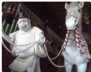
馬の手綱を引く猿

神馬舎の彫像は、彩色木彫りの第一人者、平野富山(ひらのふざん)師の作で昭和天皇御在位50年記念に奉納。日本では古くより神の御召しに供するものとして生馬を献上し神馬とする信仰があり、現在でも各神社において、神馬舎を設け神馬が奉納されています。サル(猿田彦大神)は神話より、導きの神として祀られ、さまざまな物事を良い方向へと導く御神徳があるとして、奉納されています。