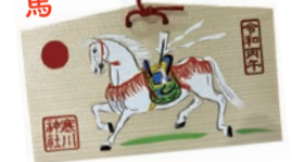
▲干支絵馬(初穂料800円) ※元日から授与(数量限定)