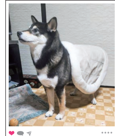
カメさんに変身！ 背中に乗せているのは お気に入りのペットです。