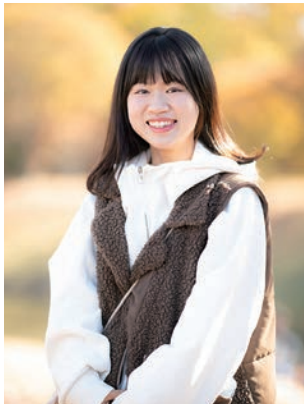
あかねねさん 遊園地で絶叫系のアトラクショ ンに乗ったとき