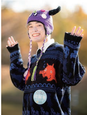
ミジコさん 研究しているときや、家族や友 達といるとき