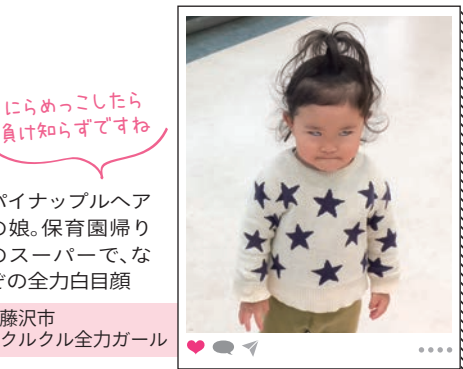
にらめっこしたら 負け知らずですね

推しが同じ友人 と遠征ライブに 行ったら、ブー ツも同じでびっ くり！ 藤沢市 ユノペン