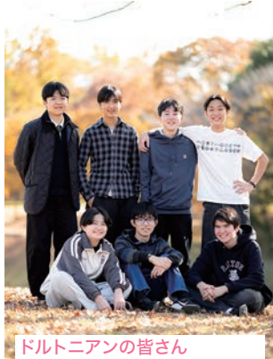
ドルトニアンの皆さん ゲームやおしゃべりをしてい るとき、アミューズメントパーク で遊んでいるとき、空港の展 望デッキで飛行機を見ていると きなど