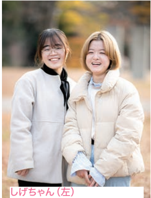
しげちゃん(左) お笑いを見ているとき、お肉を 食べているとき しいちゃん 好きなレトロ建築を見ているとき