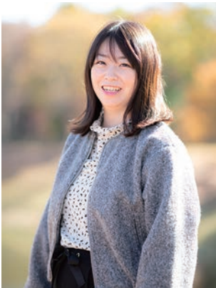
ゆみさん 服など好きなものを買ったとき