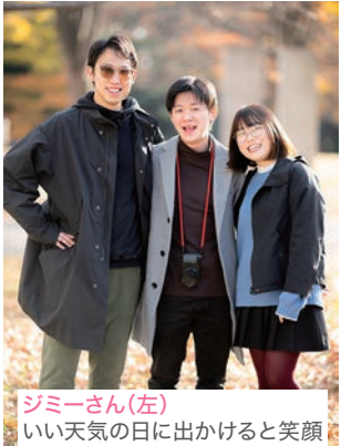
ジミーさん(左) いい天気の日に出かけると笑顔 になる タムタムさん(中央) 同期としゃべっているとき ヤダニウムさん 3Dプリンターを買ったとき