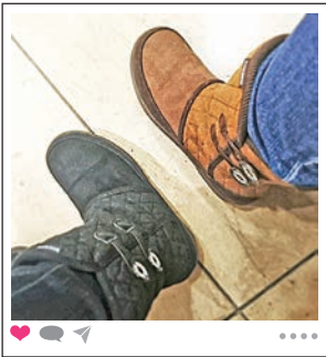
感性が同じ 友達って いいですね♪

日々の生活の中で訪れる、子どものプブツと 笑える表情や家族・ペットの面白い行動、自然 が作り出した驚きの風景など思わず激写した 「笑劇」の一枚を紹介します。