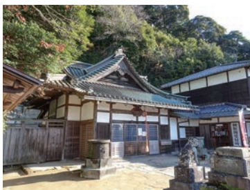
建長寺・半僧坊 鎌倉市山ノ内8 北鎌倉駅下車徒歩30分