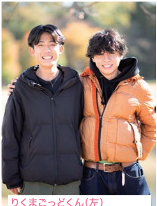
りくまごっくん(左) 友達とごはんに行き話してい るとき まさくん 世界で一番かわいい彼女の笑 顔を見ると