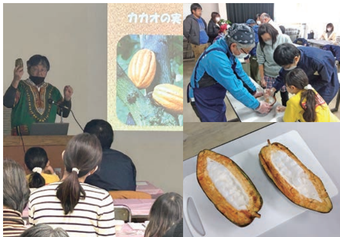
園長と一緒に、楽しくカカオについて学んで、チョコレートを作ろう！