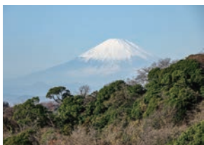
“富士見台”からの望む富士山

半僧坊富士見台からは雄大な富士山が望めます。さらに上ると「勝上けん」があり、見晴らし台からは、鎌倉の海岸や街が見られる鎌倉有数の景勝地のひとつです。