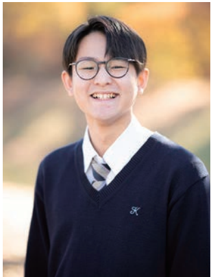
Aさん 幼稚園・小学校のときからの友 達と話すとき

昨年秋、「SFCオープンキャンパス」が実施されていた 慶應義塾大学湘南藤沢キャンパスで、キラキラの笑顔 をキャッチ！ 笑顔になるのはどんなときか、聞きました。