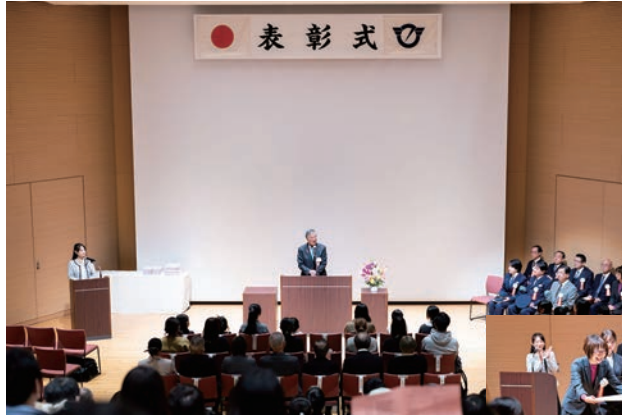
▲表彰式は藤沢市民センター・労働会館等複合施設Fプレイスのホールで開催されました