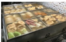
大船おでんセンターで昭和ヘタタイムスリッパ。宴会にも向いています